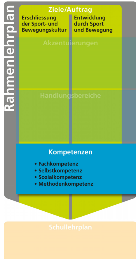
Grafik 3: Fachkompetenzen und überfachliche Kompetenzen